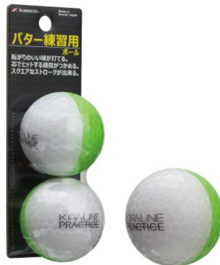
グリーン/ホワイト